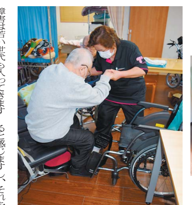
「見守り重視の介護」で利用者との関わり時間を長く持つ