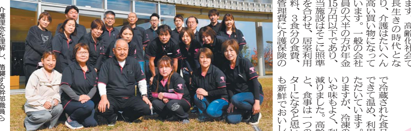
介護理念を理解し、踏襲する幹部職員らの育成に取り

在も、踏襲しています。今年で介護業界に携わり20年を迎えます。私も介護の資格を持つてい