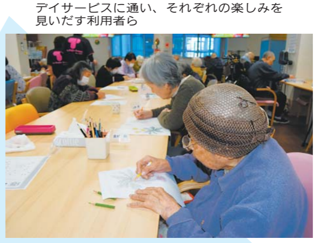
デイサービスに通い、それぞれの楽しみを見出す利用者ら