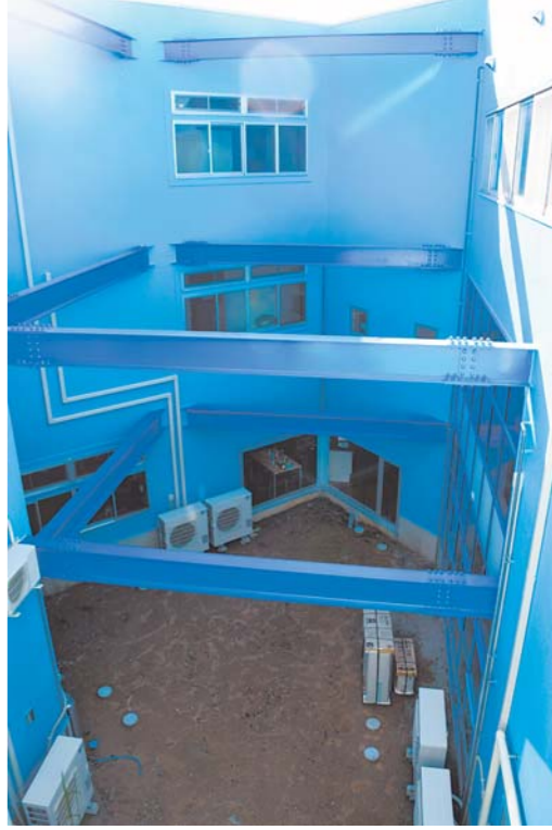
人工芝とボルタリングの設置を予定している新施設の中庭